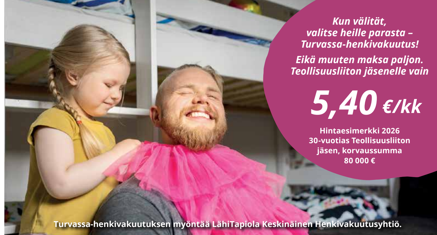
Turvassa-henkivakuutuksen myöntää LähiTapiola Keskinäinen Henkivakuutusyhtiö.

Vakuutuksessa ei ole kuolemantapauskorvausta tai pysyvän haitan korvausta. Vakuutettuina ovat osaston jäsenenä olevat eläkeläiset.